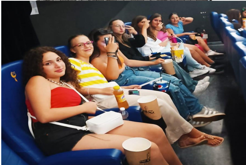
Domenica 9 Giugno in cammino verso Paola - Sabato 15 giugno insieme all'Ajnella